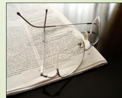
Sala de Revistas